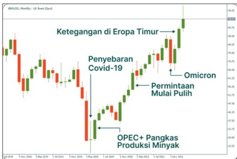
Gambar 3 Faktor - Faktor yang mempengaruhi harga minyak dunia

Selain konflik Rusia-Ukraina, terdapat beberapa faktor lain yang mempengaruhi harga minyak mentah dunia, seperti produksi minyak mentah global, permintaan global, dan kebijakan OPEC. Meskipun konflik Rusia-Ukraina dapat memengaruhi pasar minyak mentah dunia dalam jangka pendek, namun faktor-faktor lain memiliki dampak yang lebih signifikan dalam jangka panjang. Secara keseluruhan, konflik Rusia-Ukraina telah berdampak pada kegiatan hulu migas di Ukraina dan di sekitar Laut Hitam. Konflik ini menyebabkan gangguan pada infrastruktur migas dan produksi migas di wilayah tersebut, serta mengurangi pasokan energi di Ukraina.