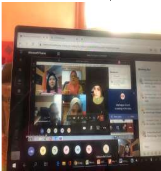
Gambar 2. Edukasi Virtual (Online)

memang dituntut untuk dapat menjalankan bisnisnya. Untuk itu pembuatan perencanaan kegiatan usaha yang pada akhirnya terkait dengan kegiatan keuangan adalah mutlak diperlukan agar pekerja harian lepas dapat memantau pelaksanaan kegiatan yang telah dilakukan dan membuat perencanaan kegiatan usaha selanjutnya.