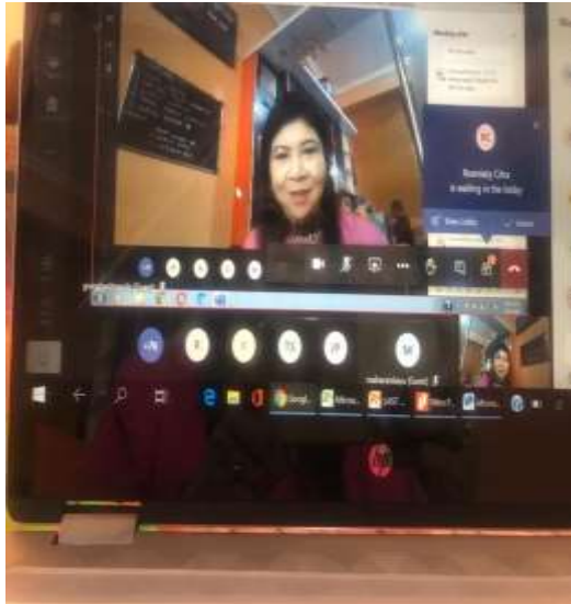
Gambar 1. Paparan Materi Presentasi