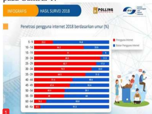
Gambar 1. Demografi Penggunaan Internet di Indonesia Berdasarkan Usia

Generasi milenial merupakan generasi terlahir pada era perkembangan teknologi dan informasi yang mengalami perkembangan dengan pesat. Generasi milenial juga disebut sebagai generasi internet booming . Penggunaan teknologi oleh generasi milenial seperti google , youtube , email dan media sosial lainnya. Menurut (Supratman, 2018), menyatakan bahwa internet bagi generasi muda atau disebut digital native merupakan bagian dari kehidupan mereka. Perkembangan usia pengguna internet di Indonesia dapat dilihat pada Gambar 1.