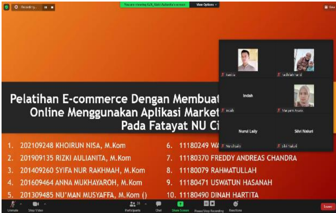
Sumber: Hasil Pelaksanaan (2021)