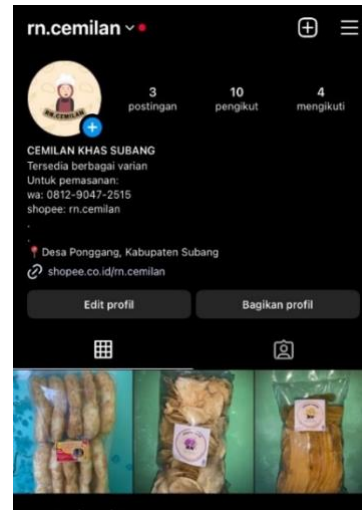
Gambar 2. Produk rn.cemilan di Instagram