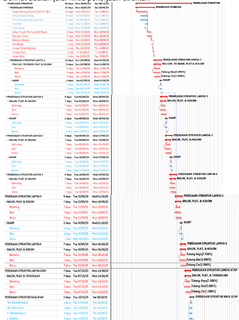
Gambar 2 Jalur Kritis Pekerjaan Struktur

lunak Microsoft Project 2024 . Network diagram ini digunakan untuk menggambarkan hubungan ketergantungan antar aktivitas pekerjaan struktur serta menentukan urutan pelaksanaan yang saling memengaruhi durasi proyek secara keseluruhan. Melalui analisis tersebut, kemudian ditetapkan jalur kritis ( critical path ) sebagai rangkaian aktivitas yang memiliki waktu pelaksanaan terpanjang dan tidak memiliki kelonggaran waktu. Berikut adalah jalur kritis pekerjaan struktur.