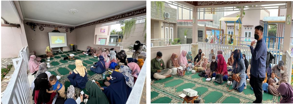
Gambar 1. Foto kegiatan penyampaian materi