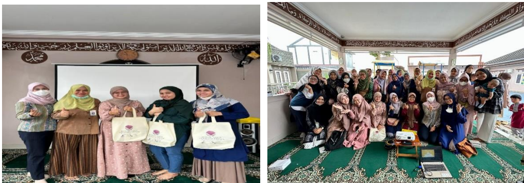
Gambar 2. Foto bersama bersama orang tua siswa/i