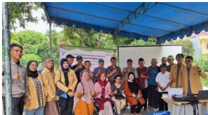
Gambar 3. Ramah Tamah dan Foto Bersama

Sebagian besar warga mengajukan pertanyaan seputar apakah pola asuh yang selama ini mereka terapkan sudah sesuai dan sebagian lainnya merasa bahwa materi yang disampaikan sudah sesuai dengan apa yang mereka terapkan keseharian, namun yang menarik ada beberapa warga yang kontra dengan materi yang disampaikan serta memberikan sudut pandang pribadi mereka, hal tersebut tentu memberikan pencerahan yang baru bagi peneliti sehingga diskusi berjalan sangat menarik serta memberikan ulasan yang positif terkait kegiatan yang berlangsung.