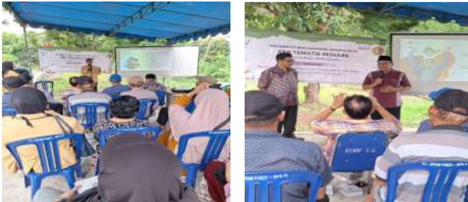
Gambar 2. Kegiatan Sosialisasi dan Diskusi

Seluruh rangkaian kegiatan berlangsung dengan baik dan lancar. Antusiasme warga cukup tinggi kami rasakan, mereka aktif dalam mengikuti kegiatan sosialisasi serta mau berdiskusi dan sharing seputar parenting dan perkembangan, jawaban dan tanggapan yang kami terima sangat variatif dari warga atas materi yang kami sampaikan.