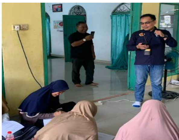
Gambar 2. Pemberian Pre-Test

Metode pelaksanaan meliputi beberapa tahapan. Pertama, dilakukan asesmen awal berupa pre-test untuk mengetahui tingkat pemahaman peserta sebelum menerima materi. Kemudian, materi psikoedukasi disampaikan secara sistematis melalui sesi presentasi dengan pendekatan interaktif. Dalam sesi ini, narasumber menggunakan media visual dan studi kasus untuk memudahkan pemahaman. Selanjutnya, diskusi kelompok dilakukan untuk melibatkan peserta secara aktif, membahas pengalaman dan tantangan yang mereka hadapi terkait bullying di lingkungan mereka.