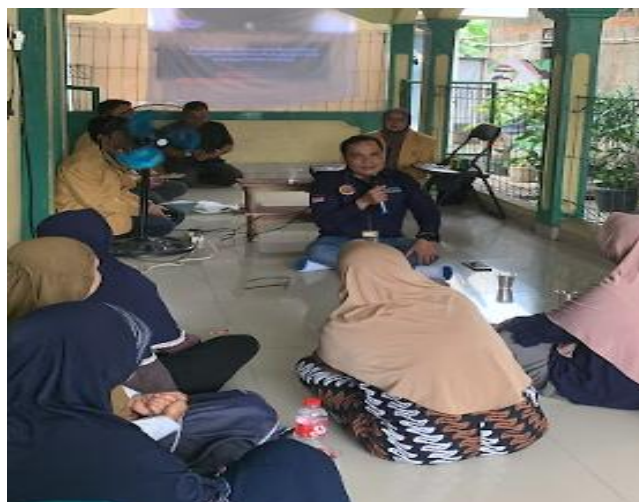
Gambar 3. Pelaksanaan Diskusi dengan Warga dan Melakukan Post-Test

Metode pelaksanaan meliputi beberapa tahapan. Pertama, dilakukan asesmen awal berupa pre-test untuk mengetahui tingkat pemahaman peserta sebelum menerima materi. Kemudian, materi psikoedukasi disampaikan secara sistematis melalui sesi presentasi dengan pendekatan interaktif. Dalam sesi ini, narasumber menggunakan media visual dan studi kasus untuk memudahkan pemahaman. Selanjutnya, diskusi kelompok dilakukan untuk melibatkan peserta secara aktif, membahas pengalaman dan tantangan yang mereka hadapi terkait bullying di lingkungan mereka.