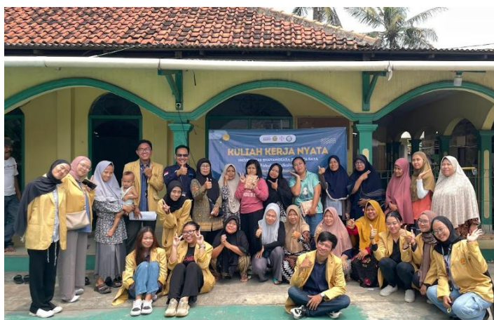
Gambar 4. Foto Bersama dengan Warga Sekitar

Salah satu temuan penting adalah peningkatan pemahaman peserta terkait risiko terjadinya bullying di lingkungan mereka. Sebelum kegiatan psikoedukasi, sebagian besar peserta menganggap bullying hanya terjadi di lingkungan sekolah atau perkotaan, sehingga mereka kurang menyadari potensi risiko di desa mereka. Melalui penyampaian materi dan diskusi interaktif, peserta mulai memahami bahwa bullying dapat terjadi di berbagai konteks, termasuk dalam lingkungan rumah, tempat kerja, dan komunitas desa. Selain itu, hasil diskusi menunjukkan bahwa beberapa peserta mulai mengidentifikasi situasi yang sebelumnya dianggap normal tetapi sebenarnya mengandung elemen bullying, seperti perilaku ejekan yang berulang dan penggunaan kekuasaan untuk memanipulasi orang lain. Temuan ini mencerminkan pentingnya edukasi yang mendalam untuk mengubah persepsi masyarakat tentang bullying.