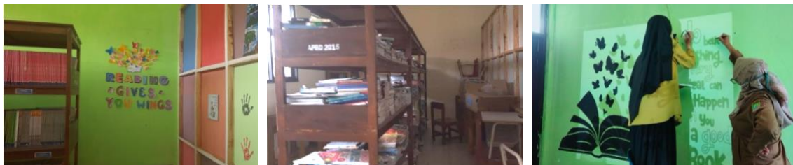
Gambar 4. Dokumentasi hasil kegiatan Revitalisasi Perpustakaan

Tahap pelaksanaan program mencakup sejumlah aktivitas penting, dimulai dari pengelompokan dan pengklasifikasian buku, pengumpulan tambahan koleksi melalui donasi, hingga penataan ulang interior perpustakaan. Kegiatan ini juga melibatkan pelabelan buku, pembuatan basis data untuk pencatatan buku, serta penyediaan buku peminjaman dan kartu anggota bagi siswa. Semua langkah ini dirancang untuk membangun kembali sistem perpustakaan yang rapi dan fungsional.