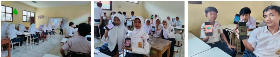
Gambar 3. Dokumentasi hasil kegiatan Pelatihan Canva

Kegiatan pelatihan ini dilaksanakan pada siswa kelas 8. Untuk mengoptimalkan hasil pembelajaran, pelatihan dibagi menjadi dua sesi. Sesi pagi diperuntukkan bagi siswa kelas 8.1, sedangkan sesi siang ditujukan untuk siswa kelas 8.2. Pembagian ini dimaksudkan agar setiap siswa memperoleh pengalaman belajar yang lebih personal dan efektif. Materi yang disampaikan mencakup pengenalan antarmuka Canva, prinsip dasar desain grafis, hingga praktik membuat desain poster sederhana. Dalam setiap sesi, para fasilitator juga memberikan ruang diskusi kelompok untuk mendorong interaksi dan pertukaran ide di antara siswa, dokumentasi kegiatan diperlihatkan oleh Gambar 3.