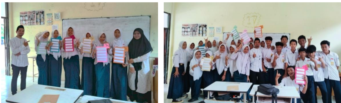
Gambar 5. Dokumentasi hasil kegiatan inovasi metode pembelajaran menggunakan TGT

Melalui metode TGT, siswa dibagi ke dalam kelompok yang bersifat heterogen, dengan setiap anggota kelompok memainkan peran penting dalam keberhasilan timnya. Proses pembelajaran diawali dengan penyampaian materi secara interaktif, diikuti dengan sesi permainan atau turnamen berbasis kuis yang menguji pemahaman materi. Kegiatan ini tidak hanya memperkuat penguasaan materi oleh siswa, tetapi juga membangun keterampilan sosial seperti komunikasi, kerja sama, dan empati.