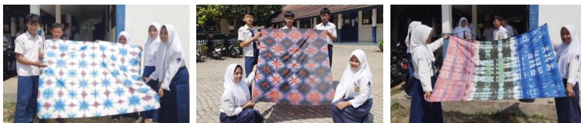
Gambar 5. Dokumentasi hasil kegiatan pembuatan Batik Sibori

Kegiatan dilaksanakan bersama siswa kelas 8 yang dibagi ke dalam enam kelompok per kelas. Setiap kelompok diberi kebebasan untuk bereksperimen dalam melipat dan mengikat kain putih menggunakan berbagai metode, yang kemudian direndam dalam larutan pewarna. Proses ini menciptakan pola-pola unik yang muncul setelah kain dikeringkan dan ikatannya dilepas. Siswa juga diberi kesempatan untuk mencoba kombinasi warna yang berbeda guna menghasilkan desain yang lebih kompleks, dokumentasi kegiatan diperlihatkan oleh Gambar 5.