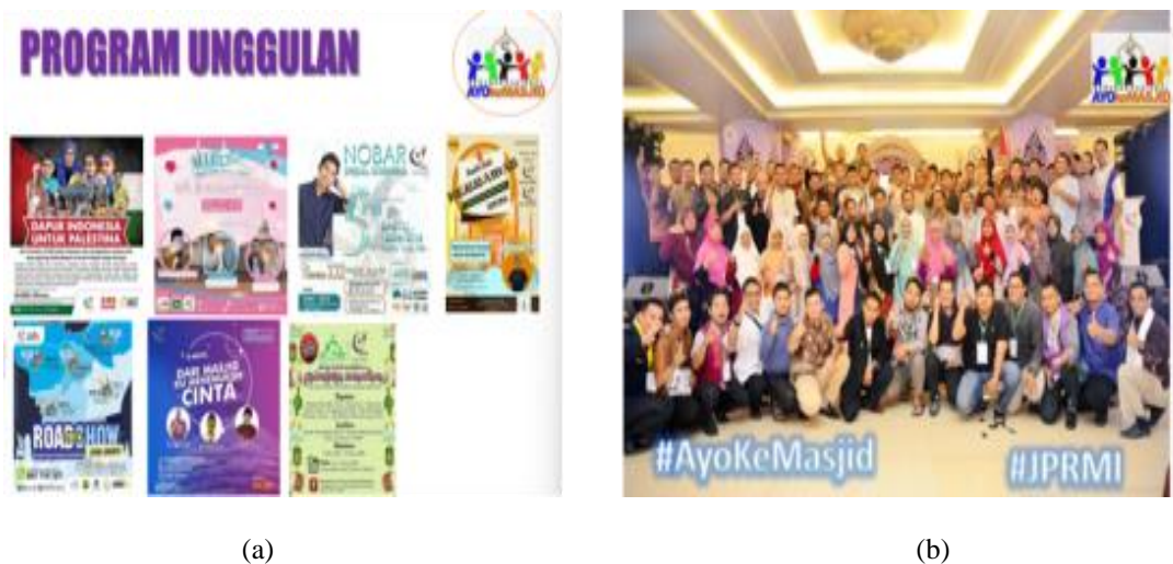
Sumber: Arsip Jaringan Pemuda dan Remaja Masjid Indonesia (2022) Gambar 2. Dokumentasi Kegiatan (a) Program Unggulan Jaringan Pemuda dan Remaja Masjid Indonesia, Kegiatan Gerakan Nasional Ayo Ke Masjid (b)

sudah banyak yang menggunakan komputer karena lebih praktis dan efisien. Pada Jaringan Pemuda dan Remaja Masjid Indonesia (JPRMI) saat ini beberapa data yang ditampilkan masih terbilang manual, penggunaan aplikasi Google Form pada pengolahan data yayasan masih belum maksimal digunakan dikarenakan beberapa pengurus masih belum mengerti penggunaan dari Aplikasi yang digunakan yaitu Google Form , Permasalahan pada Jaringan Pemuda dan Remaja Masjid Indonesia (JPRMI) banyak ditemukan dalam mengelola data Donatur, data anak Asuh, Pengolahan data keuangan dan Pembuatan Undangan atau Proposal Dana yang kurang rapi serta tidak tersimpan sebagai dokumentasi. Google Form sendiri merupakan aplikasi perangkat lunak yang dimanfaatkan untuk mengolah, menyimpan, dan mengombinasikan data berbentuk dokumen Adapun pembuatan dokumen ini menggunakan aplikasi Google Form , diantaranya yang menjadi fokus dan sering digunakan. (Andriyanto et al., 2021)