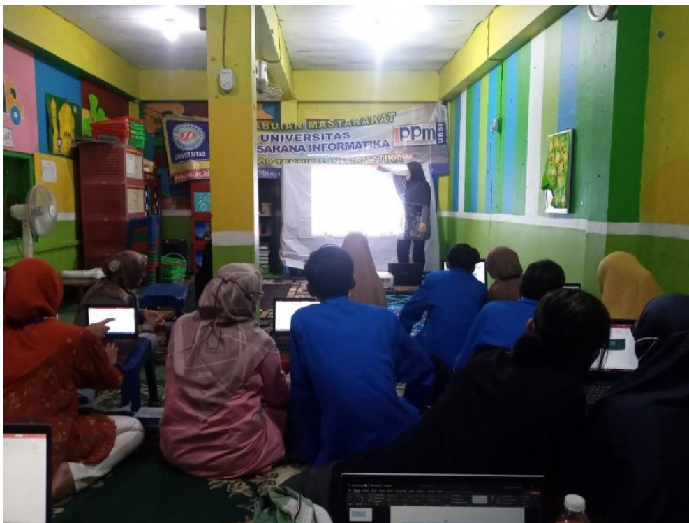
Gambar 2. Pengurus dan guru TPQ sedang mempratikan teori yang disampaikan

Pada awal kegiatan, para peserta akan diberikan pemaparan materi dasar penggunaan Microsoft Powerpoint . Untuk melaksanakan kegiatan tersebut digunakan beberapa metode pelatihan, yaitu metode ceramah, dimana kami menjelaskan mengenai kegunaan dari beberapa menu atau fitur Microsoft Powerpoint untuk membuat presentasi yang menarik. Selain itu, kami juga membuat salinan hard copy kepada guru untuk lebih memudahkan pemahaman guru tentang aplikasi Microsoft Powerpoint . Setelah ceramah oleh tutor, dilakukan tanya jawab. Tanya jawab ini diharapkan peserta memperoleh pengetahuan dan pemahaman yang lebih dalam tentang materi yang telah dijelaskan sebelumnya. Selanjutnya, kami mengarahkan dan mendampingi peserta dalam mempraktekkan penggunaan teks dasar dan shape pada Microsoft Powerpoint . Hal ini dilakukan dengan proses direct instruction , dimana kami mencontohkan terlebih dahulu yang kemudian diikuti oleh peserta pelatihan. Para peserta diminta untuk membawa perangkat laptop yang akan digunakan untuk praktek.