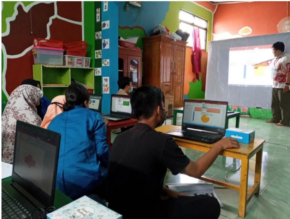
Gambar 3. Contoh hasil pelatihan pengurus dan guru TPQ

Pada gambar 3 merupakan contoh hasil pelatihan pengurus dan guru TPQ Nurul Jihad. . Di akhir sesi pemateri melakukan evaluasi terkait pemberian materi yang telah disampaikan dengan cara memberikan pertanyaan dan memberikan kesempatan kepada peserta untuk menjawab pertanyaan tersebut. Kemampuan pemahaman peserta diperoleh berdasarkan hasil evaluasi terhadap para peserta. Peserta yang mampu menjawab akan diberikan hadiah.