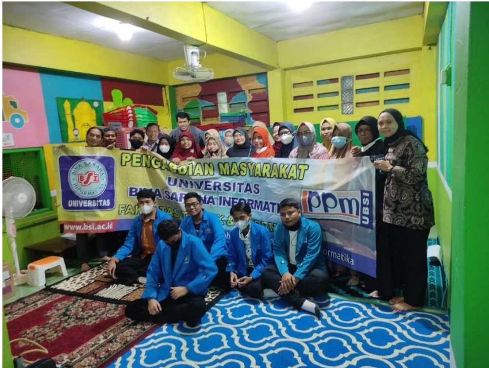
Gambar 4. Foto Bersama setelah selesai pelatihan

Hasil dari kegiatan Pengabdian kepada Masyarakat (PkM) ini juga dipublikasikan melalui media elektronik yaitu Gunakan Teks Dasar Dan Shape Dalam Membuat Presentasi Yang Menarik yang terbit pada hari Minggu, 9 Oktober 2022 diperlihatkan oleh Gambar 5. Hasil dari pelatihan aplikasi Microsoft Powerpoint ini akhirnya dapat dirasakan manfaatnya oleh para pengajar. Kemanfaatan tersebut diantaranya mengetahui pentingnya ilmu pengetahuan dibidang teknologi komputer dalam metode pembelajaran, memudahkan para pengajar dalam penyampaian materi, membuat bahan ajar menjadi lebih menarik dan tidak membosankan. Karena selain teks yang ditampilkan juga dibantu dengan variasi shape .