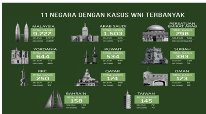
Gambar 2. Negara Dengan Kasus WNI Terbanyak 20 Oktober 2015 - 20 Oktober 2016

Sumber: Kaleidoskop Perlindungan WNI 2016 Tahun Kedua Kabinet Kerja, Kementerian Luar Negeri RI.