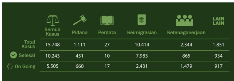
Gambar 1. Rekapitulasi Kasus WNI di Seluruh Dunia 20 Oktober 2015 – 20 Oktober 2016